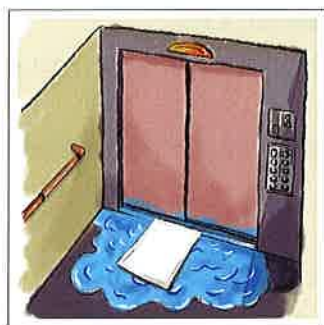
■ エレベーター 機械室の浸水に