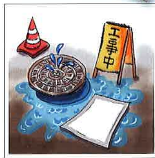
■ 工事現場の浸水に